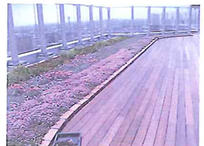
屋上庭園 癒しの空間に…