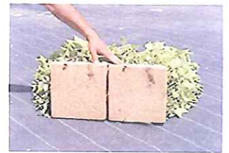
上：専用育成トレイ(T-1トレイ) 下：根がマット状になっている