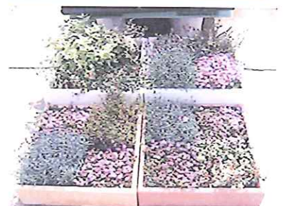
ベランダガーデンも簡単！