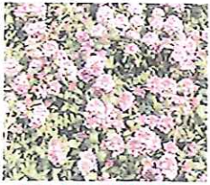
タイム ロンギカウリス

屋上緑化や人工地盤での植栽を想定し開発された植物で、植栽基盤を選ばず、多様なニーズに対応できる新緑化素材です。