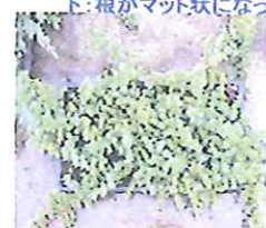
ハイネズ ブルーバシフィック