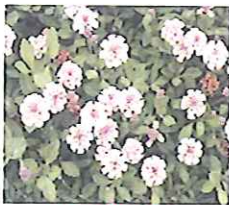
ヒメイワダレソウ